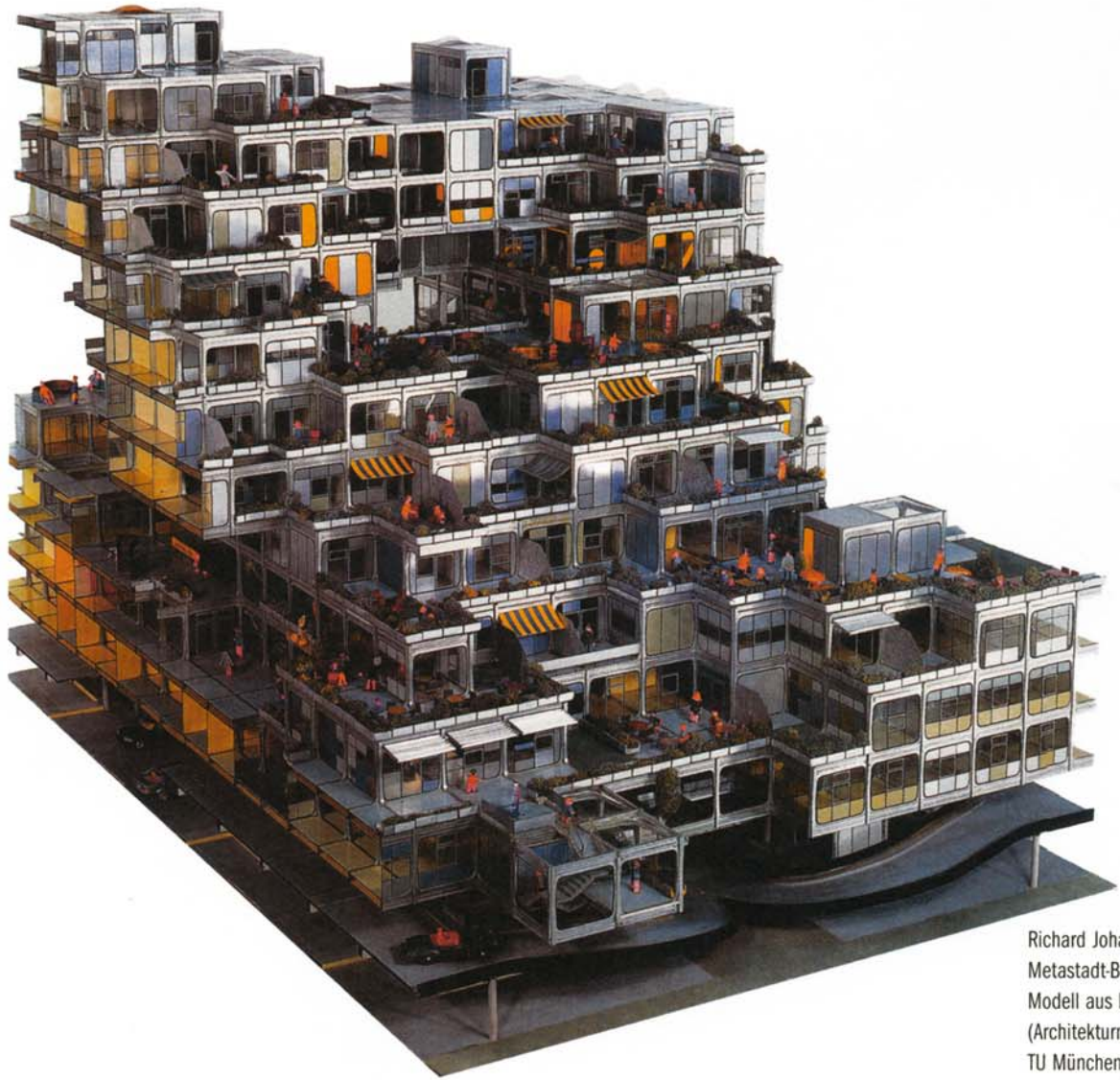
Richard Johann Dietrich: Metastadt-Bausystem, Modell aus Kunststoff, 1976 (Architekturmuseum der TU München)

Jedes Wohnhaus ist für die Zukunft gebaut. Wie werden wir aber wohnen, wenn die Gebäude alt geworden sind? Verschiedene Fachleute legen ihre Zukunftsvisionen dar. Paul Knüsel